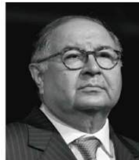
Алишер Усманов Управляеенец и предприниматель, миллиардер, основатель USM Holdings

«Познание мира через финансы — очень увлекательная вещь! Гораздо более увлекательная, чем, например, делание самих денежных знаков или увеличение их количества. Поэтому что ты не можешь вкладывать деньги в то, что не существует.»