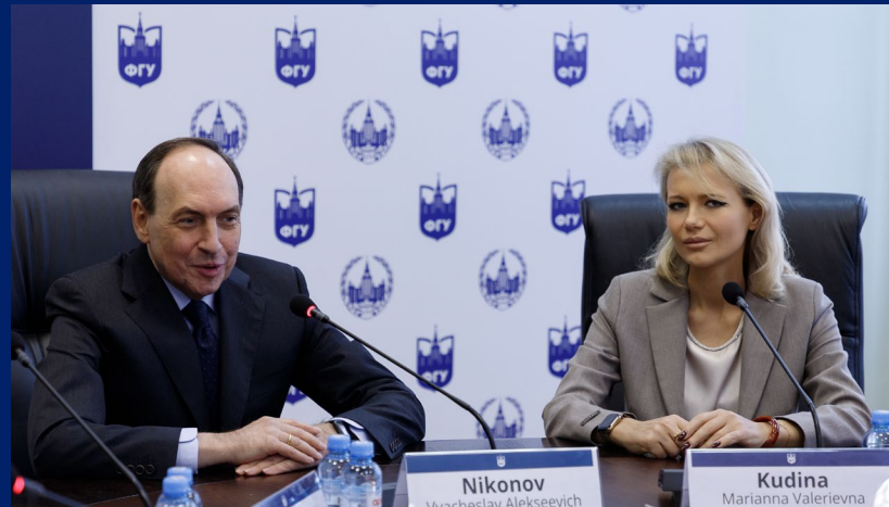
Dean – Prof. Vyacheslav Nikonov 院长- 维切斯拉夫 尼科诺夫教授