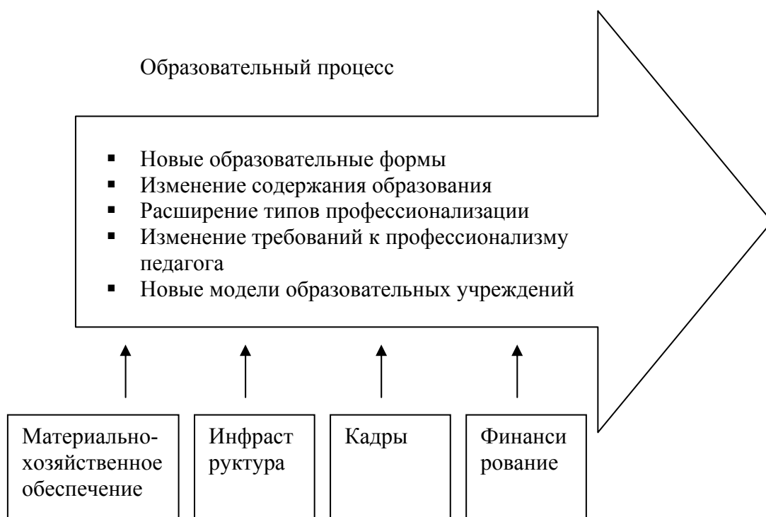
Схема 1. Составляющие образовательной политики, обеспечивающие воспроизводство (рост) и развитие системы.

составляющие государственной образовательной политики. Первая – это обеспечение воспроизводства системы образования. В рамках этой деятельности можно отслеживать динамику роста отрасли (объем финансирования образования, количество образовательных учреждений, число обучающихся и др.). Однако рост количественных показателей не гарантирует, что происходит развитие образования, под которым понимается качественное улучшение системы связанное с изменением, параметров изображенных на схеме 1.